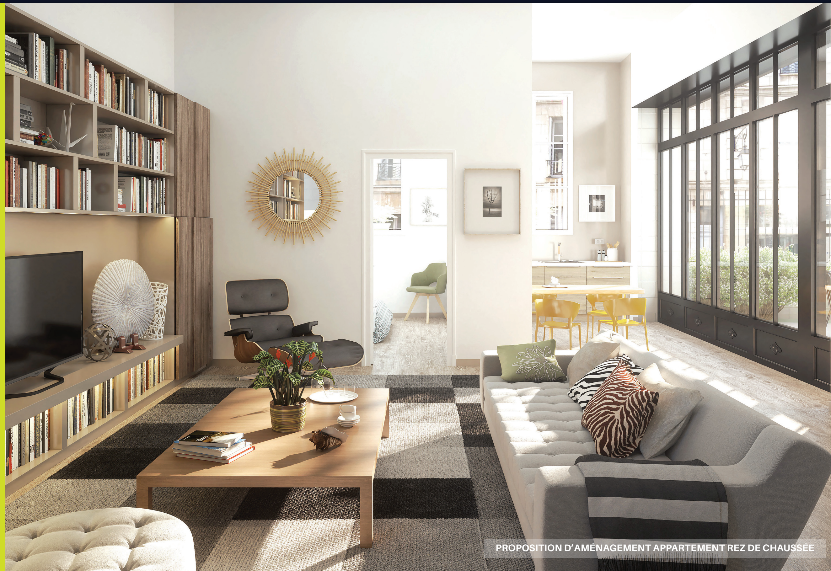
PROPOSITION D'AMÉNAGEMENT APPARTEMENT REZ DE CHAUSSEE